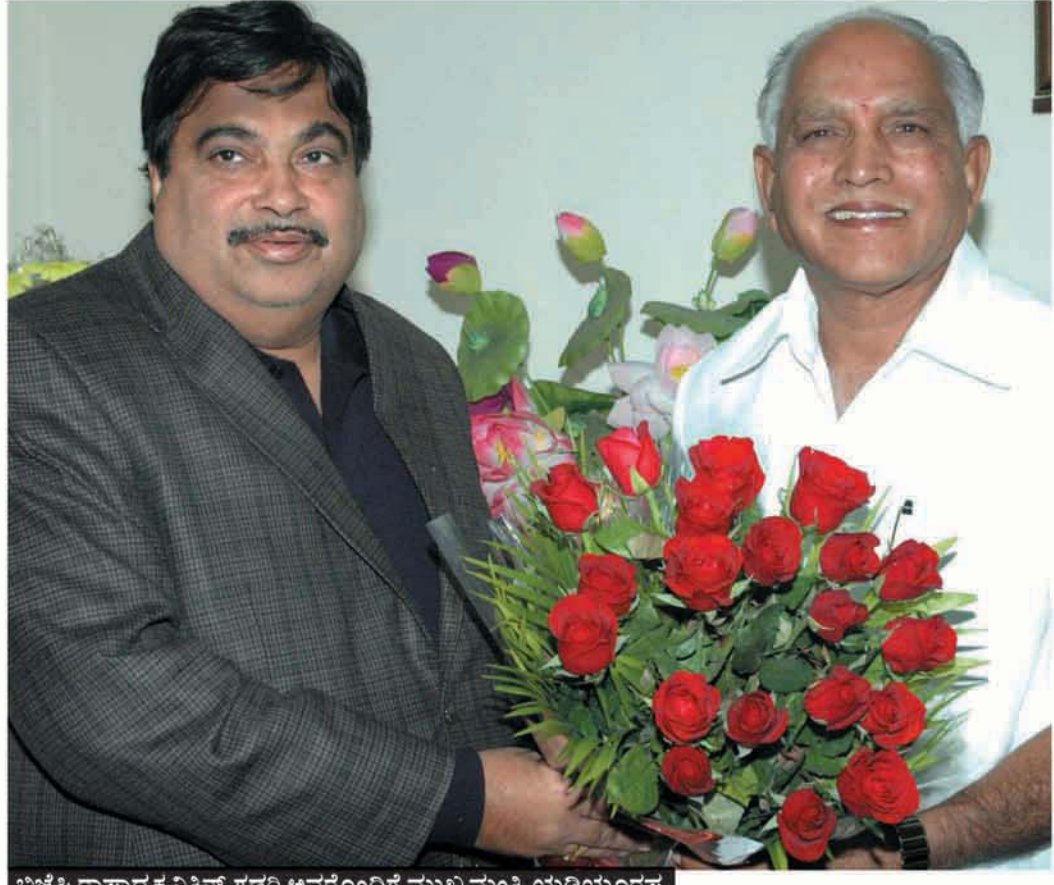
ಬಿಜೆಪಿ ರಾಜ್ಯಾಧ್ಯಕ್ಷ ನಿಶಿತ್ ಗಡ್ಕರಿ ಅವರೊಂದಿಗೆ ಮುಖ್ಯಮಂತ್ರಿ ಯಡಿಯೂರಪ್ಪ